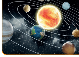
Dünya hem kendi ekseninde hem de Güneş'in etrafında döner.