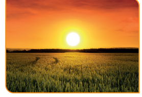
Güneş bu sabah Ankara'da saat 06.00'da doğdu.

Bu görsel ve bilgilerden hareketle aşağıdakilerden hangisi söylenemez ?