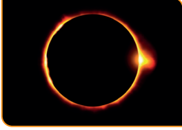
10 Ocak 2020'de Türkiye'de Ay tutulmuştur.