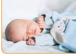
10 Ocak 2020'de Bir çocuk dünyaya gelmiştir.